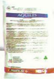
Aquiles 300 g/ha (3 sobres)