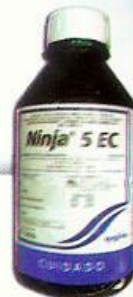
Ninja 5 EC 300 cc/ha