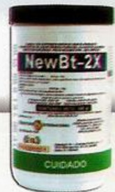
New Bt-2X 500 g/ha