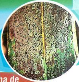
Mancha de Asfalto